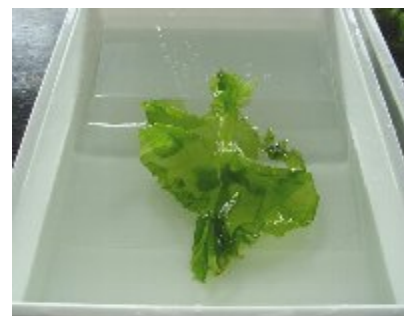
海藻を水につけておく

採集した海藻、バット（食器などを洗う方形のもの）、ケント紙、プラスチックの下敷き、新聞紙、さらし（ガーゼを重ねても良い）、厚い本、板、ブックコート（本の修理用の透明紙シート）